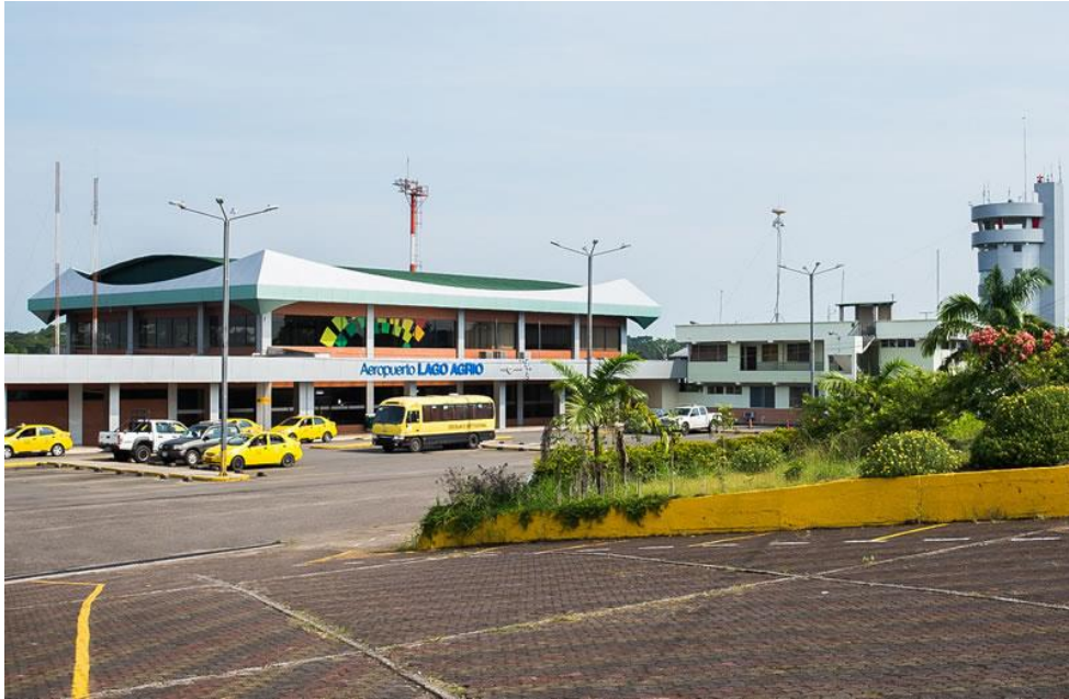
LAGO AGRIO (NUEVA LOJA) HAVALİMANI

Lago Agrio Havalimanı, Hercules C-130 veya Boeing 727 u aĐını alabilmektedir. Havalimanı, 150.000 yolcu kapasiteli terminale sahiptir. Bu terminal, restoranlar, g venlik noktaları, askeri mevcudiyet ve revir gibi farklı havalimanı hizmetleri sunmaktadır. 220 arabalık otoparkı bulunmaktadır.