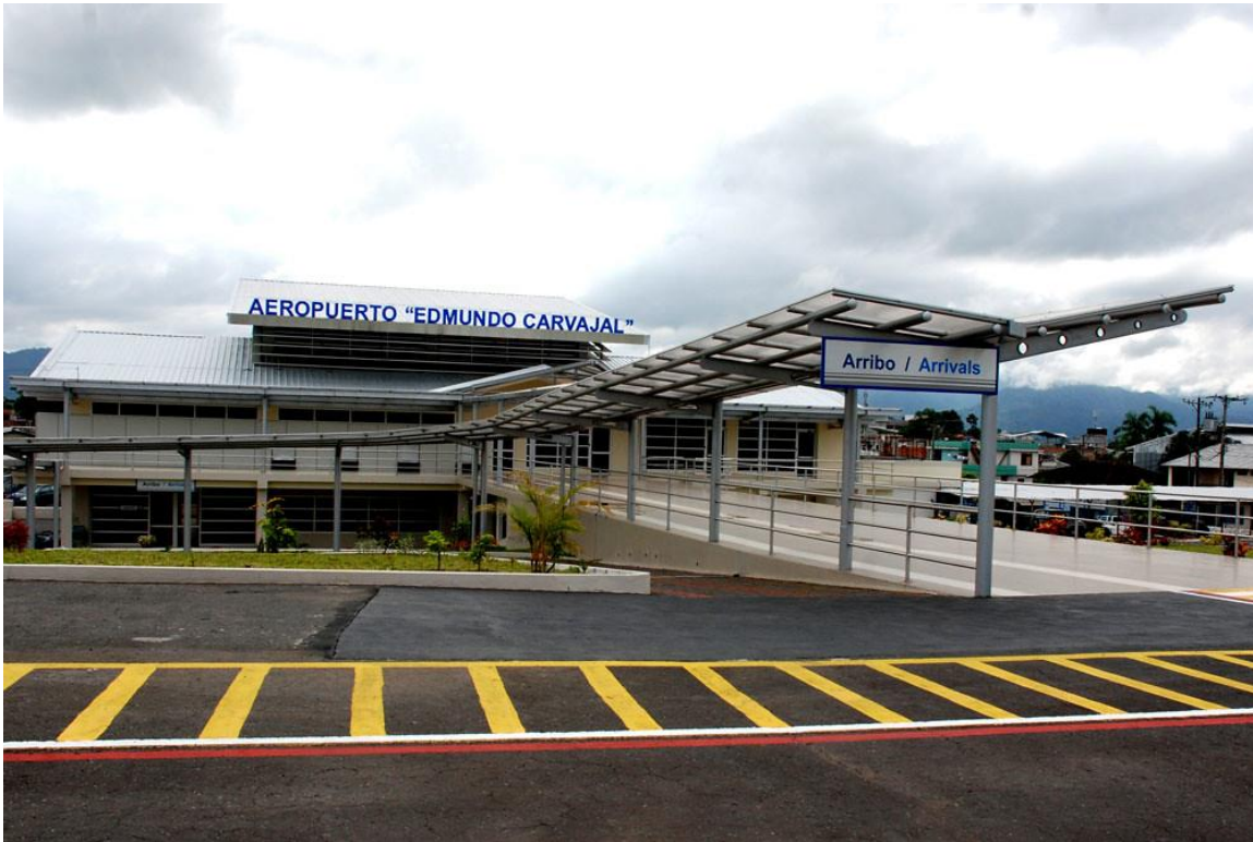
CORONEL EDMUNDO CARVAJAL HAVALIMANI

Coronel Edmundo Carvajal Havalimani, Ekvator'un Macas Őehrinde yer almaktadır. Pist uzunluĐu 2.500 metre, geniŐliĐi 30 metredir. Havalimanının deniz seviyesinden y ksekliĐi 2.411 metredir.