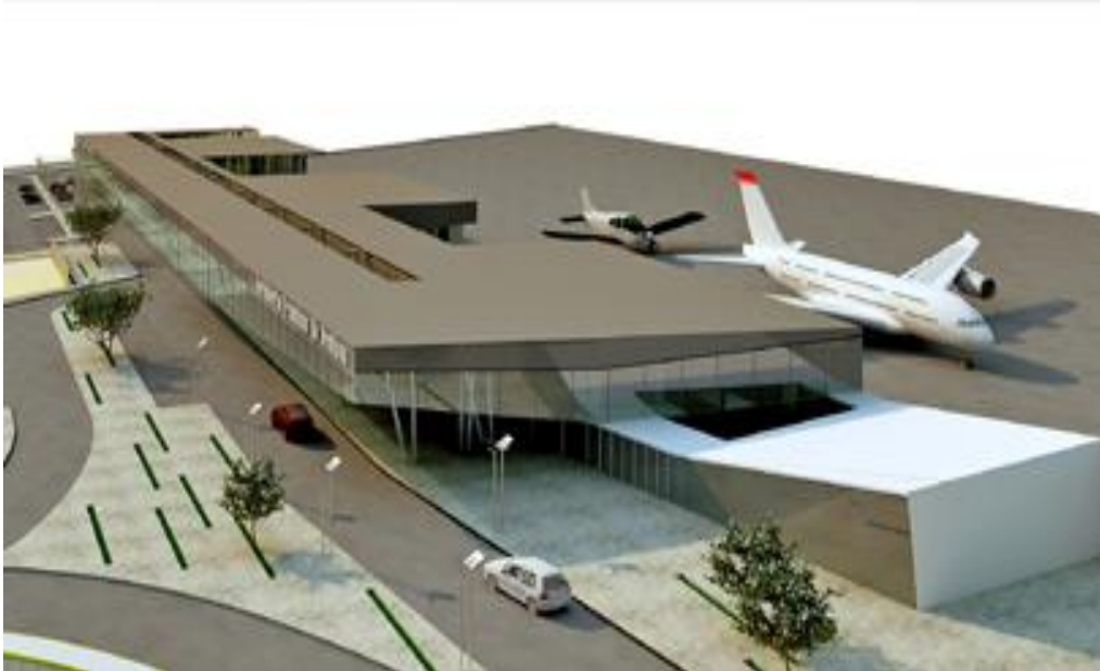
FRANCISCO DE ORELLANA HAVALİMANI

Havalimanının pist uzunluğu 2.060 metre, genişliği 27 metredir. 100.000 pound ağırlığındaki uçaklar iniş yapabilmektedir. Yolcu terminali, kontrol kulesi, kanalizasyon sistemleri ve otoparkları bulunmaktadır.