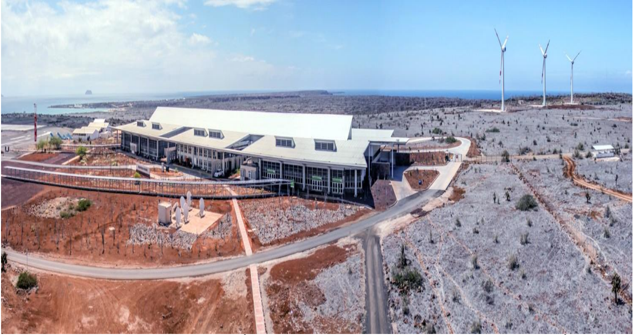
BALTRA SEYMOUR HAVALİMANI (GALAPAGOS EKOLOJİK HAVALİMANI)

Pist uzunluğu 2.400 metre, genişliği 36 metredir. Havalimanının deniz seviyesinden yüksekliği 207 metredir. 6000 metrekarelik otomatik mekanik panjurlar bulunmaktadır. Ayrıca, havayı düzenlemek için sıcaklık ve Co2 sensörlerine sahiptir.