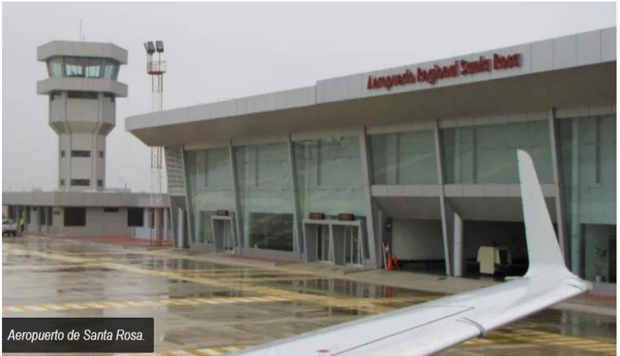
SANTA ROSA BÖLGE ULUSLARARASI HAVALİMANI (EL ORO)

Pist uzunluğu 2.500 metre, genişliđi 45 metredir. Uçaklar için geniş park yerine sahiptir. Kito, Guayaquil ve diđer şehirlere düzenli ticari uçuşları vardır.