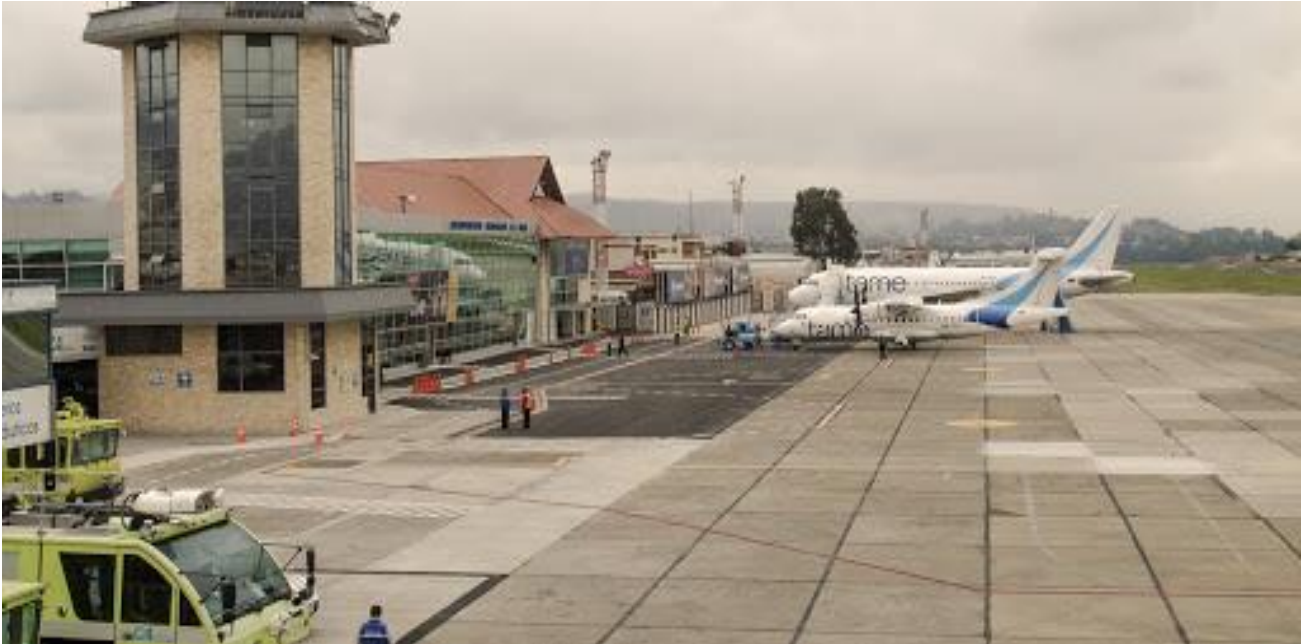
LAMAR DE CUENCA HAVALİMANI

Mariscal Lamar de Cuenca Havalimanında, pist uzunluĐu 1.900 metre, geniŐliĐi 36 metredir. Pist esnek kaldırım  zerine inŐa edilmiŐtir. Havalimanının y ksekliliĐi deniz seviyesinden 2.532 metredir ve 24,8 santigrat derece referans sıcaklıĐına sahiptir.