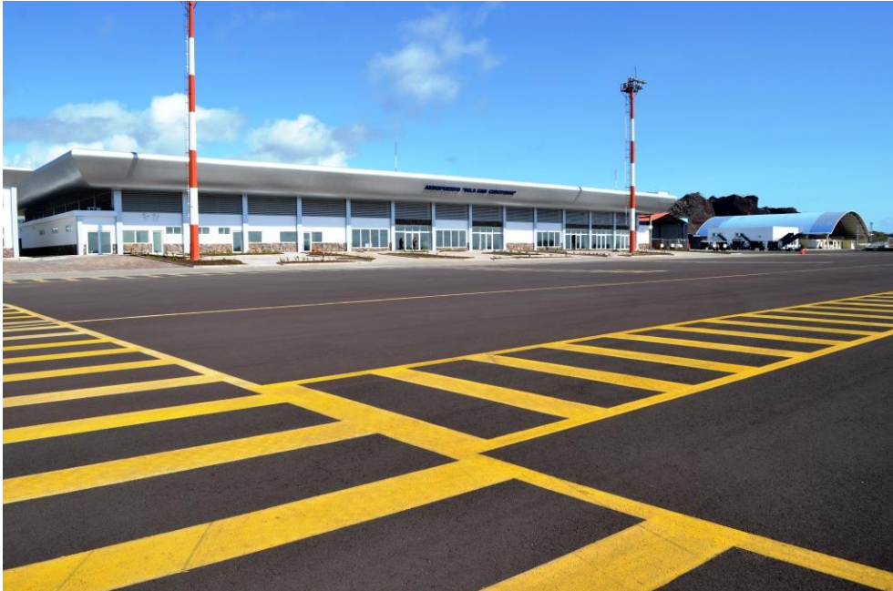
SAN CRISTOBAL ADASI HAVALİMANI

Pist uzunluĐu 1.894 metre, geniřliĐi 20 metredir. 300 metrekarelik teknik bloĐu vardır. 3.842 metrekarelik terminalinde kontrol alanları, bagaj teslimatı, bilgi ekranları, yolcular i in eriřim sistemi, havayolu ofisleri, ticari binalar, yangın sistemi bulunmaktadır.