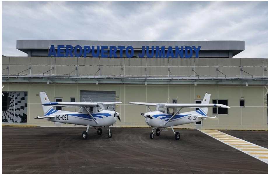
INTERNACIONAL JUMANDY HAVALİMANI

Pist uzunluğu 2.600 metredir. Boeing 767 büyüklüğündeki uçakları kabul edebilmektedir. Yolcu terminali 150 yolcuyu alabilmektedir. Havalimanı yakıt depoları 22.000 galon kapasiteye sahiptir.