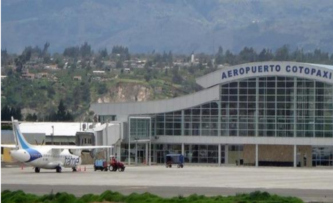
COTOPAXI ULUSLARARASI HAVALİMANI (LATACUNGA)

Havalimanının deniz seviyesinden y ksekliĐi 2.806 metredir. Havalimanı pisti 3.693 metredir. Havalimanı, Boeing 747 u aĐı kabul edebilmektedir.