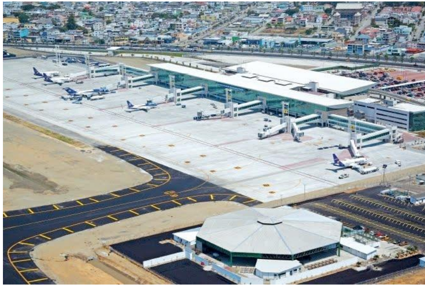
JOSE JOAQUIN DE OLMEDO GUAYAQUIL ULUSLARARASI HAVALİMANI

Havalimanının yüksekliği 6 metredir. Guayaquil'in kuzeyinde yer almaktadır. 31 santigrat derece referans sıcaklığına sahiptir. Pist uzunluğu 2.684 metre, genişliği 45 metredir. Ayrıca, uçak parkı için sekiz alan, kargo uçađı park yeri için sekiz alan, iki lojistik destek aracı ve acil durumlar için iki ambulans bulunmaktadır.