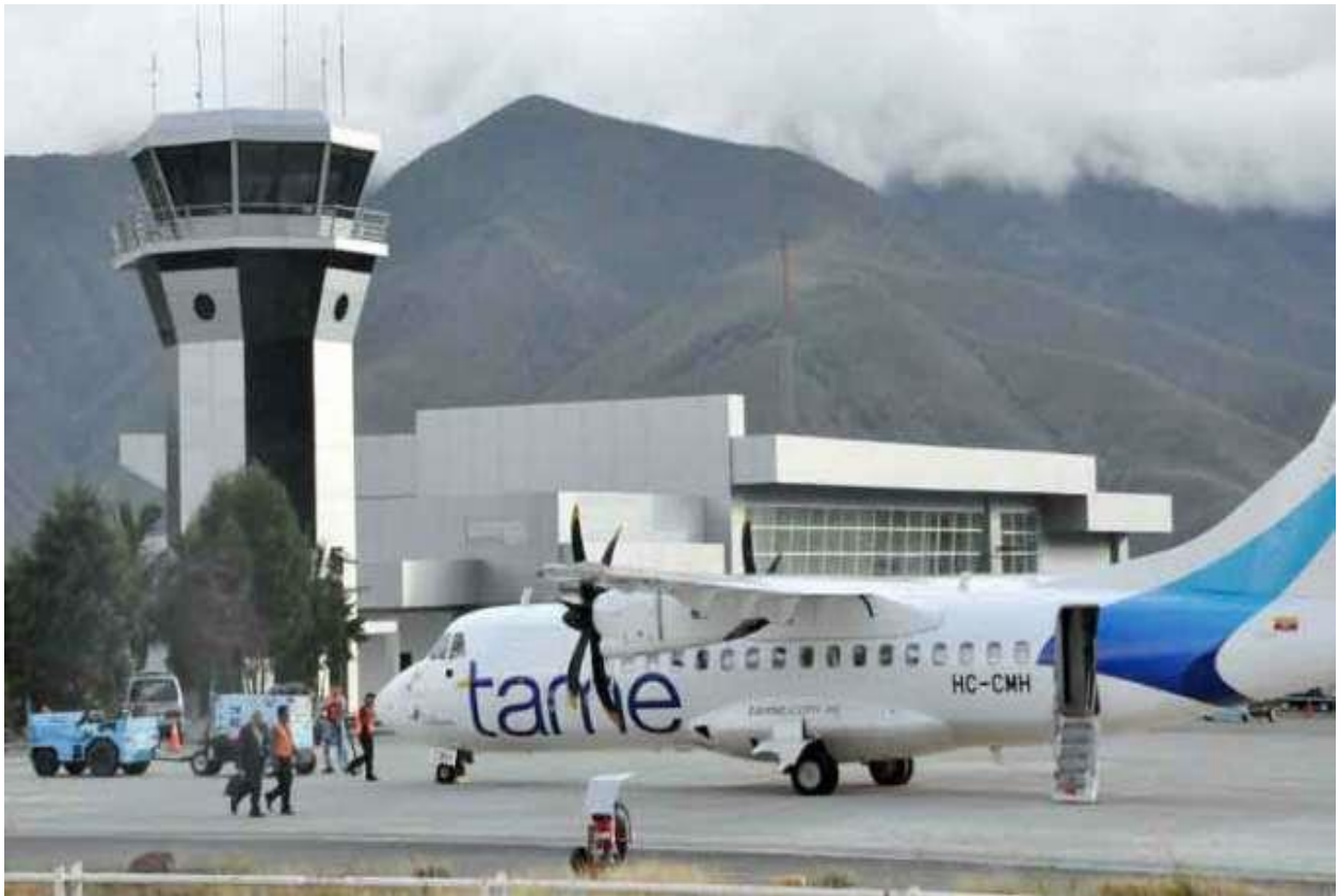
CATAMAYO ŐEHRI HAVALİMANI

Havalimanını inŐa etmek iin 20 milyon dolar yatırım yapılmıŐtır. Modern bir kontrol platformuna sahiptir.