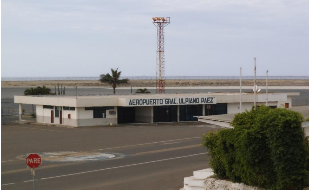
GENERAL ULPIANO PAEZ SALINAS HAVALİMANI

Havalimanı 298 hektarlık bir alana sahiptir. Pist uzunluu 4.098 metredir. Terminali 200 kiŐilik kapasiteye sahiptir. Havalimanı aynı anda iki ticari uuŐ alabilmektedir.