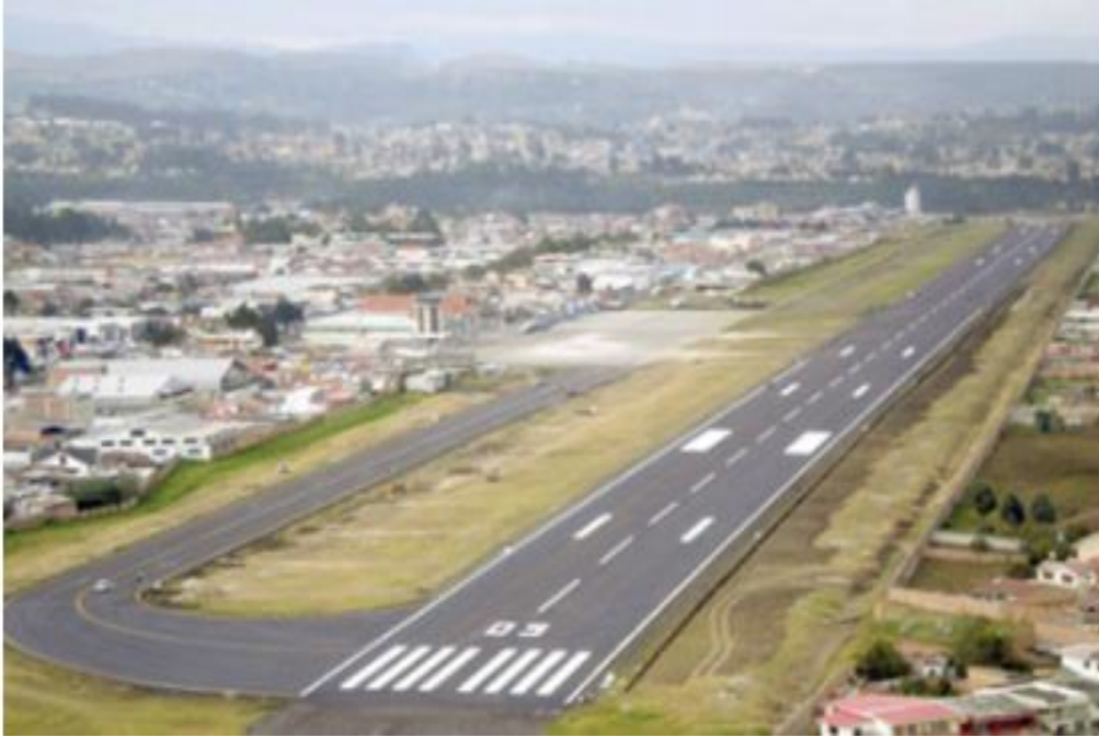
ELOY ALFARO MANTA ULUSLARARASI HAVALİMANI

Eloy Alfaro Uluslararası Havalimanı, t m hizmetlerin verildii 1.200 metrekarelik bir Terminale sahiptir. Pist uzunluu 2.852 metre geniřlii 45 metredir. 18.000 metrekare alana ve sert kaldırımdan uak platformuna sahiptir. Havalimanı, SSEI Kurtarma ve Yangınla M cadele Hizmetinin 7. kategorisinde yer almaktadır.