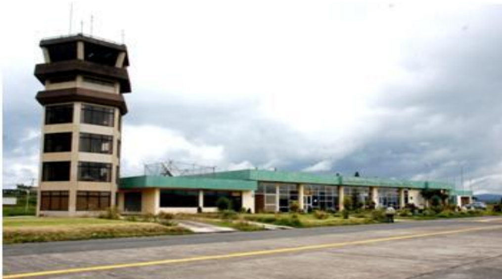
TENIENTE CORONEL LUIS A. MANTILLA HAVALİMANI

Havalimanının deniz seviyesinden y ksekliĐi 2.941 metredir. 20 santigrat derece referans sıcaklıĐına sahiptir. Havalimanının Őu anda ticari faaliyeti bulunmamaktadır. Havalimanında g mr k, g ĉ kontrolu, kalite kontrol, saĐlık hizmetleri, taksi hizmetleri, turizm b roları gibi hizmetler bulunmaktadır.