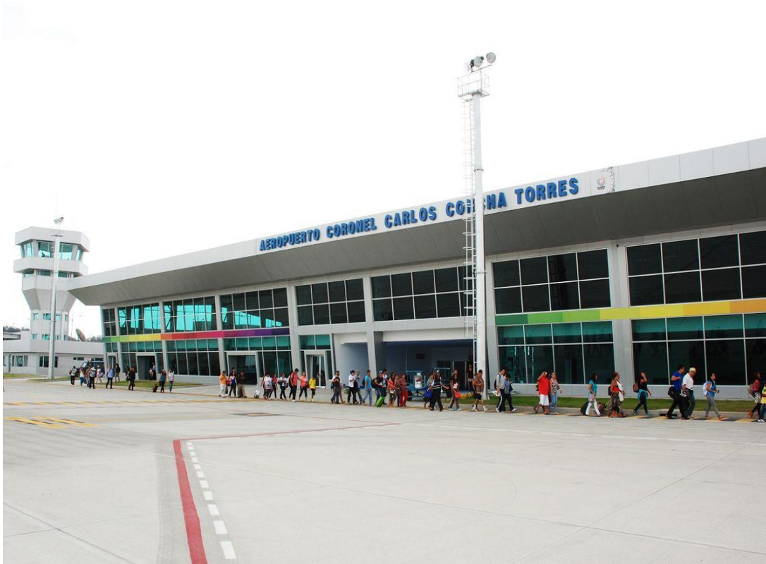
CORONEL CARLOS COCHA TORRES ULUSLARARASI HAVALİMANI

Havalimanının pist uzunluğu 4.098 metre, genişliği 45 metredir. Havalimanını ve şehri birbirine bağlayan bir otoyol bulunmaktadır.